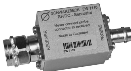
Einspeiseweiche: EW 7110 AC/DC separator: EW 7110