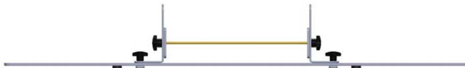
Abb. 3: Line 1 Kalibrierstandard (für hohe Frequenzen) Fig. 3: Line 1 calibration standard (for high frequencies)