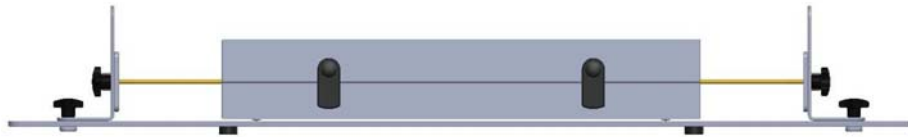
Abb. 5: CMAD 1614 im Kalibrieradapter mit Line 2 Fig. 5: CMAD 1614 in calibration fixture with Line2