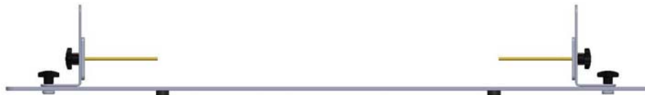
Abb. 1: Reflect Port 1 und Reflect Port 2 Kalibrierstandards Fig. 1: Reflect Port 1 and Reflect Port 2 calibration standards